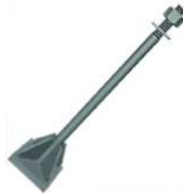
Imagem 02 – Chumbador pré-concretagem