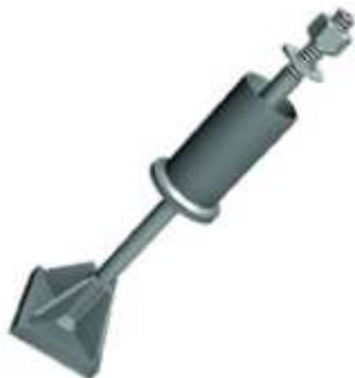
Imagem 01 – Chumbador pré-concretagem